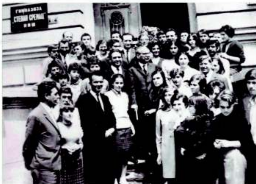
Иво Андрић испред Гимназије „Стеван Сремац“ са ученицима и професорима, 1. јуна 1968. године.