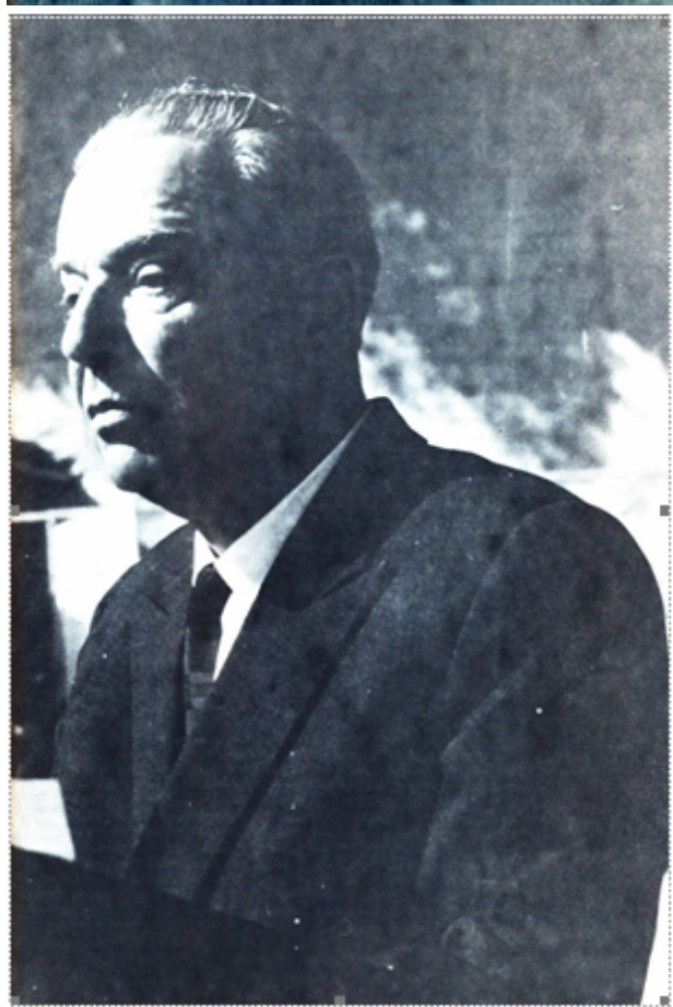
Илустрација уз наведени текст из часописа Градина , стр. 285. Аутор ове и фотографије на корицама: Јован Шурдиловић

Тиме бих завршио овај свој празнични поздрав вама, млади другови, вашим наставницима и Универзитету, са жељом да из њега дуго, у миру и напретку, излазе срећни, здрави нараштаји слободоумних и слободних, стваралачких и човечних људи, на радост свих нас, на добро овог краја, на срећу и напредак целе социјалистичке Југославије.