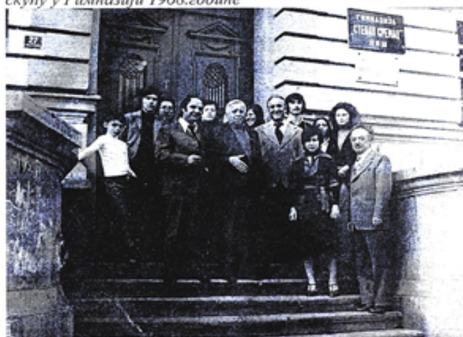
Њиџевник Бранко Ћопић у посети Гимназији 1975