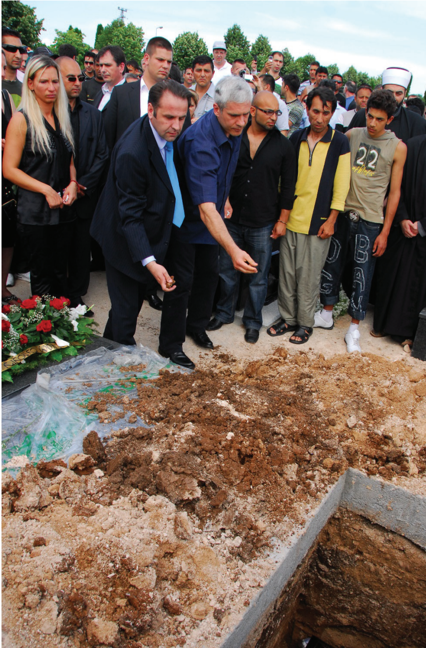
Слика 7: Председников и министаров последњи опроштај од Шабана (Д. Митић Цар, 2008)