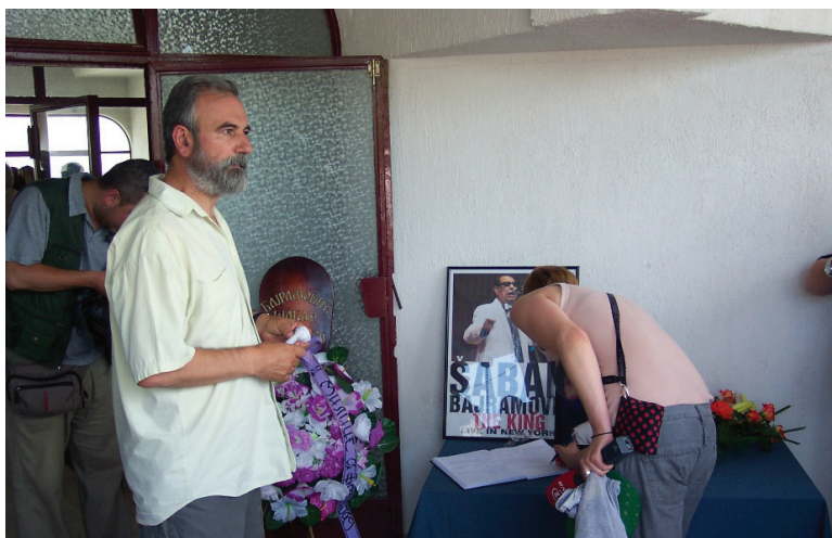
Слика 1: У реду за уписивање у књигу жалости (Д. Тодоровић, 2008)