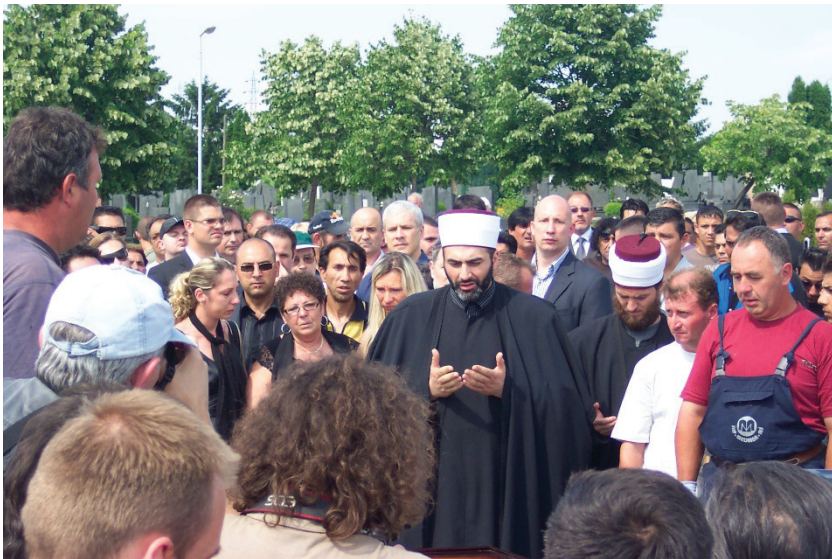
Слика 6: Муфтијина молитва над раком (Д. Тодоровић, 2008) (у позадини председник Борис Тадић)