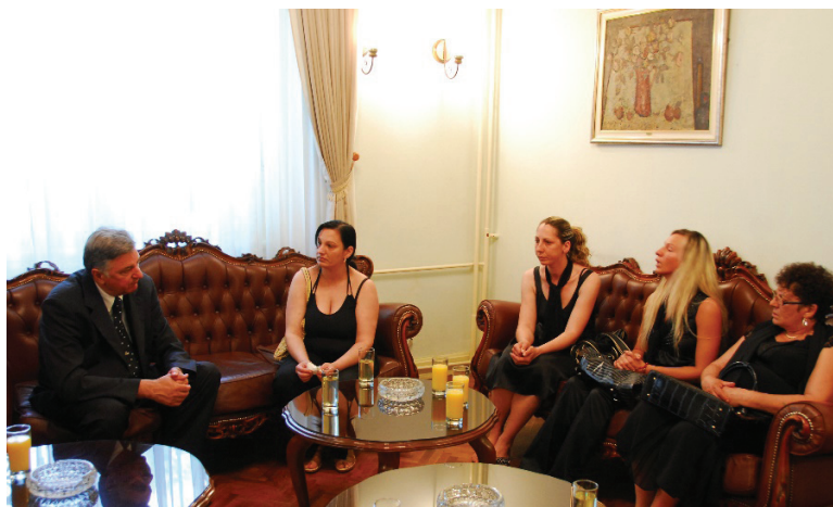
Слика 2: Фамилија Бајрамовић код градоначелника уочи комеморације (Д. Митић Цар, 2008)