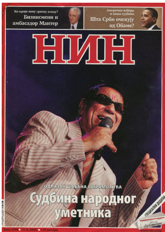
Слика 8: Насловна страна НИН -а од 12. јуна 2008 (В. Петровић, 2017)