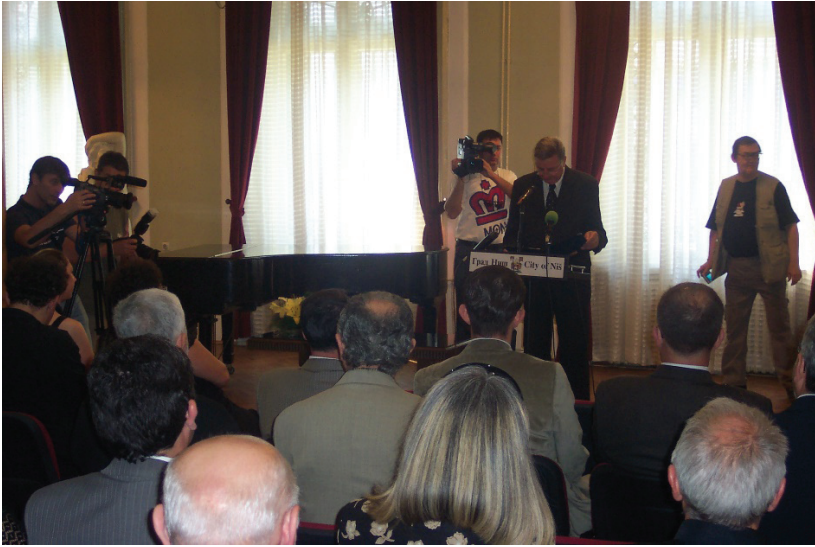
Слика 3: Градоначелник Ниша мр Смиљко Костић говори на Шабановој комеморацији (Д. Тодоровић, 2008)