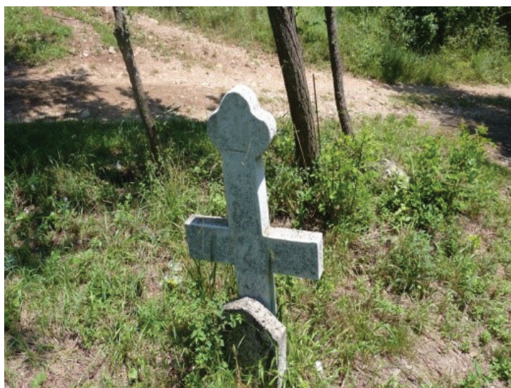
Слика 7: Крст без исписа (Сретко Лепојевић)