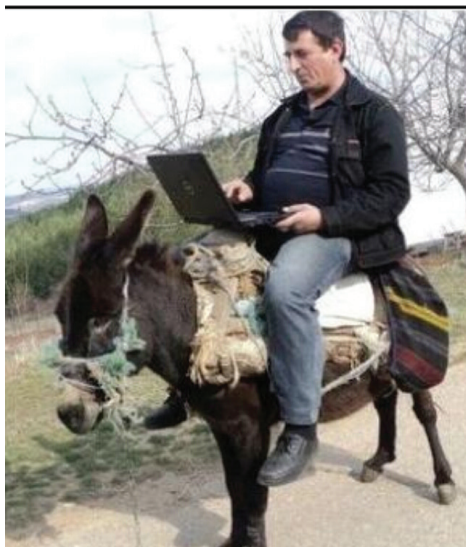
Слика 3: „Истраживач“ на магарцу с лаптопом у бисагама (интернет, 2018)