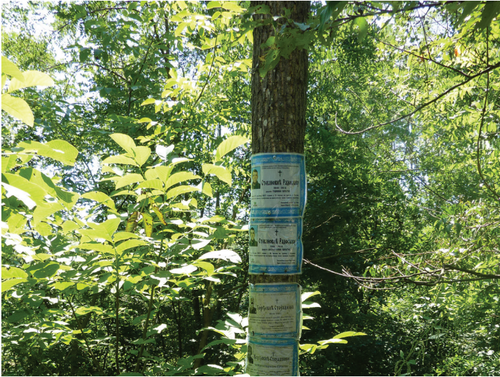
Слика 9: Умрлице на тополама