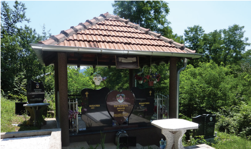
Слика 15: Покривен надгробник