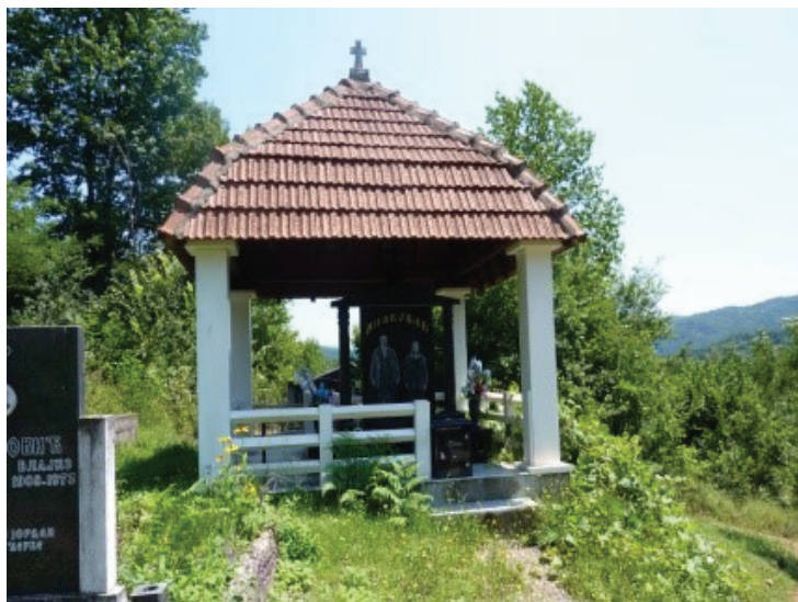
Слика 16: Наткривен гроб