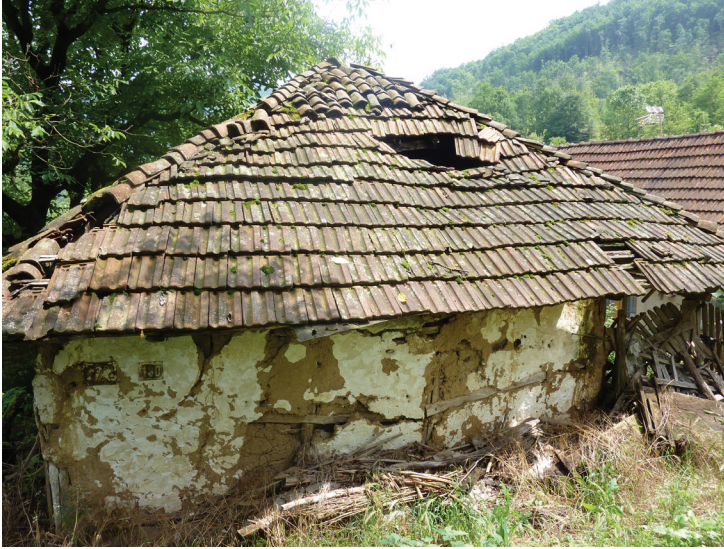
Слика 1: Оронули дом 22