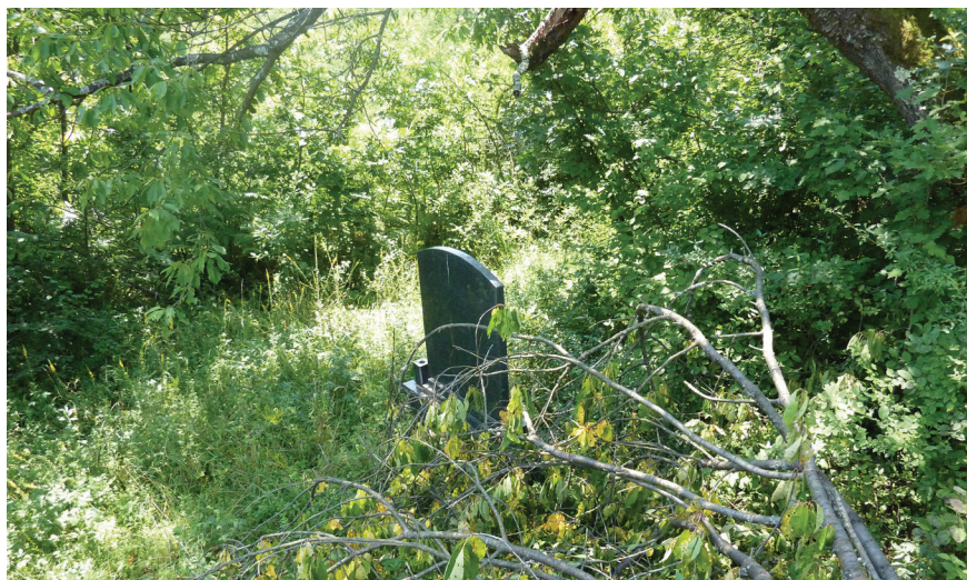
Слика 17: На улазу у нове парцеле