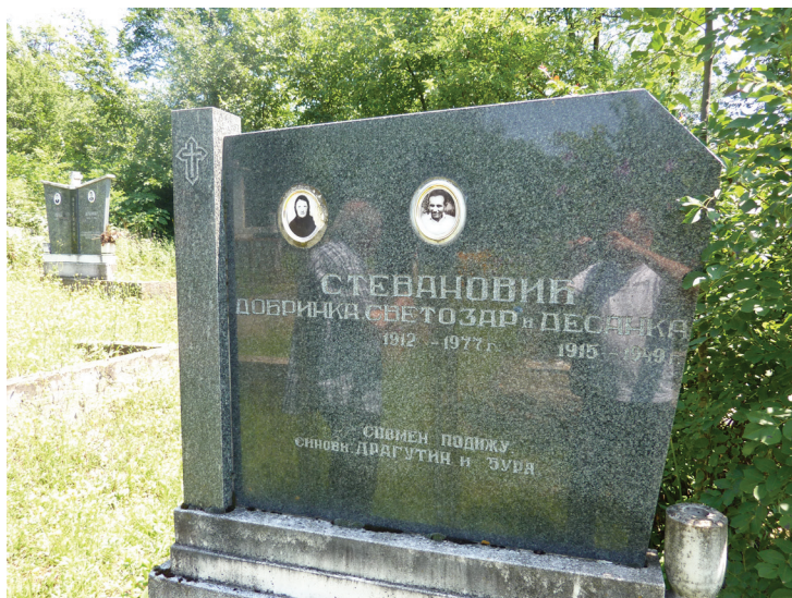
Слика 5: Помајка, отац и мајка Ђуре Стевановића