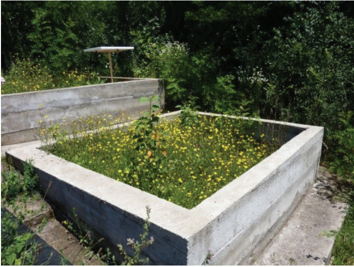
Слика 14: Парцела је спремна