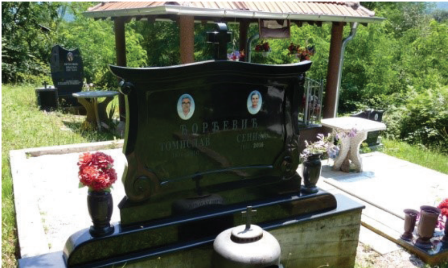
Слика 13: Мермерни сточићи