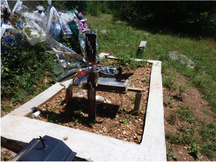
Слика 12: Последњи укоп до јула 2018.