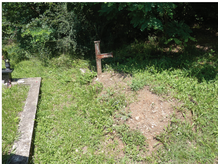
Слика 6: Скршена крстача на хумки сиротице Верице Лепојевић