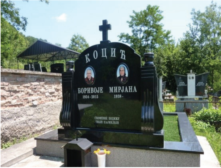
Слика 10: Клесарско потекло