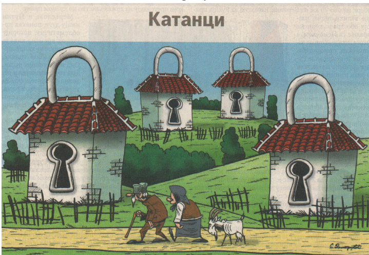
Слика 1а: Катанци (С. Димитријевић, 2018)