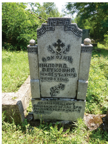
Слика 4: Пребачен камен Милорада Петковића