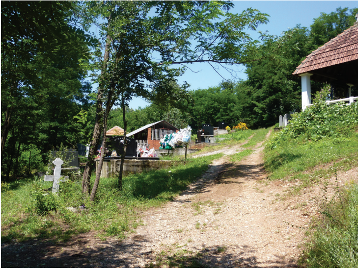
Слика 8: Панорама гробља из улазног правца