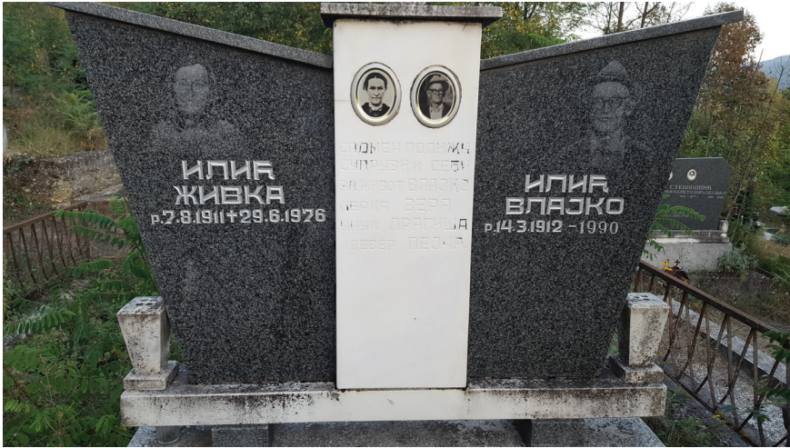
Слика 11: Споменик Живке и Влајка Илића