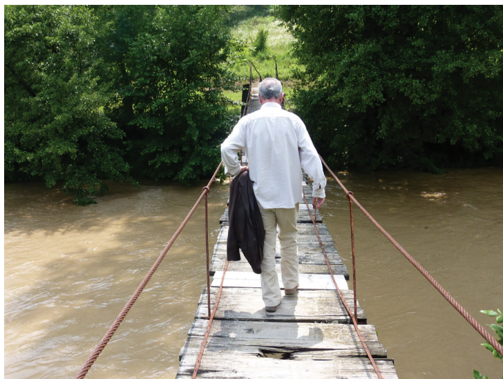
Слика 2: Висећи мостић преко Власине