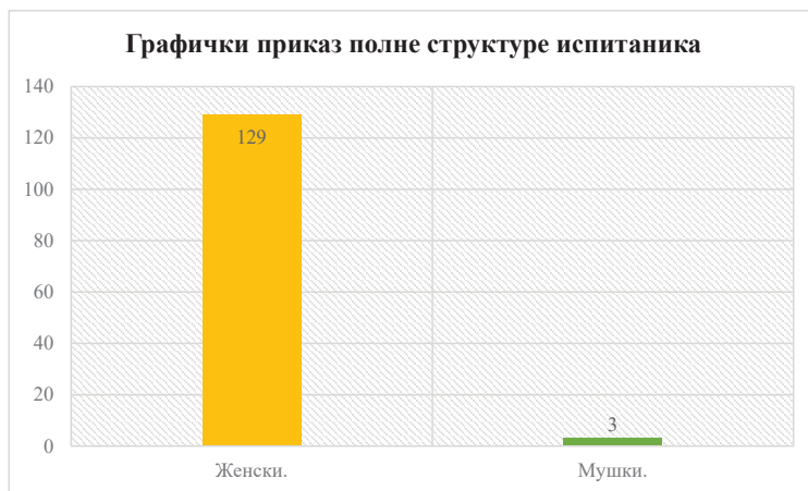
Графички приказ 1. Полна структура испитаника

У истраживању је учествовало 132 наставника, од чега је 129 испитаника женског пола, а само 3 испитаника мушког пола. Међу испитаницима највише је оних који раде у основним школама на територији Републике Србије (93 испитаника), затим у средњим стручним школама (27 испитаника) и гимназијама (12 испитаника).