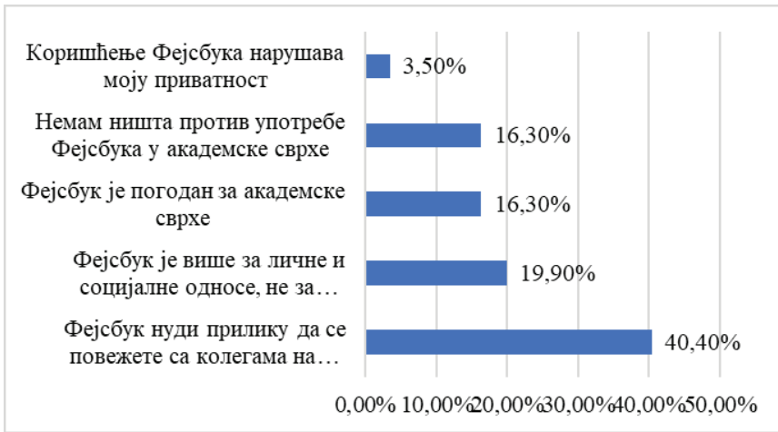
Графикон 2. Коришћење Фејсбука у академске сврхе

У Табели 1 приказани су резултати истраживања о сагласности са тврдњама које се односе на употребу сајта друштвене мреже Фејсбук у академске сврхе. Највећи проценат студената јесте делимично (34.4%) или у потпуности (31.7%) сагласан са тврдњом да употреба Фејсбука унапређује комуникацију између студената: 19.2% студената је неодлучно, а најмањи проценат испитаних студената сматра да употреба Фејсбука не може значајно допринети комуникацији између студената (4.4% у потпуности и 10.3% делимично). Насупрот томе, 37.3% испитаних студената сматра да Фејсбук не побољшава комуникацију између студената и професора; једна четвртина испитаника је неодлучна (26.2%), а 36.1% студената види Фејсбук као алат за унапређивање комуникације професора и студената.