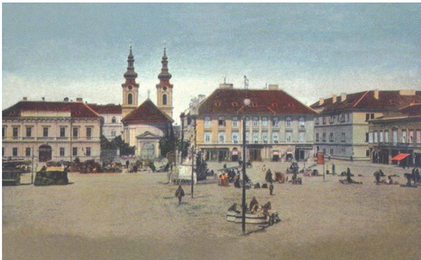
Foto 2. Piața Unirii, înainte de 1905 cu vechea fațadă a palatului episcopal sârbesc specifică barocului târziu clasicizant