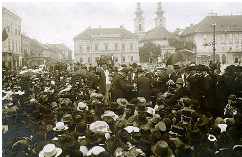
Foto 1. Palatul episcopal sârbeșc din Timișoara (Piața Unirii) înainte de reconstrucția fațadei realizată de Laszlo Szekely. (surse Arhiva episcopiei Romano-Catolice din Timișoara, fotografie datată 1903 în perioada alegerilor contelui Apponyi)