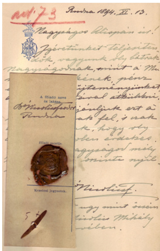
Прилог бр. 4: Писмо барона Федора и Михајла Николића из 13 новембра 1894. у вези са донацијом једне вредне нумизматичке збирке темишварском музеју.