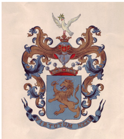
Прилог бр. 2: Баронски грб породице Николић од Рудне (друга половина 19. века)