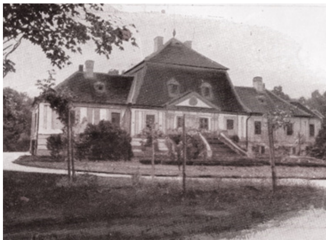
Прилог бр. 5: Конак или „Каштел” породице Николић у Рудни почетком 20. века