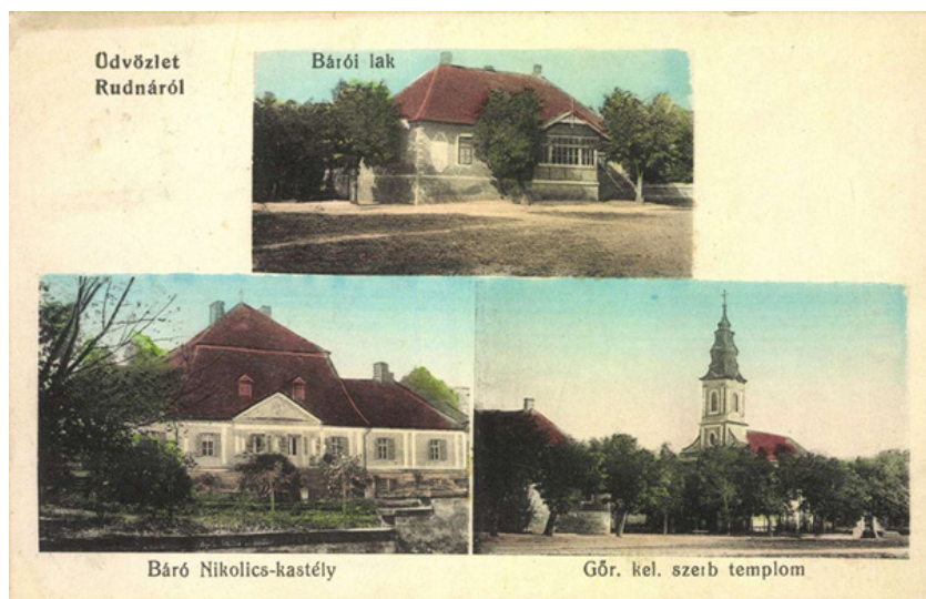
Прилог бр. 6: Разгледница Рудне с почетка 20. века баронска вила, конак и српска црква.