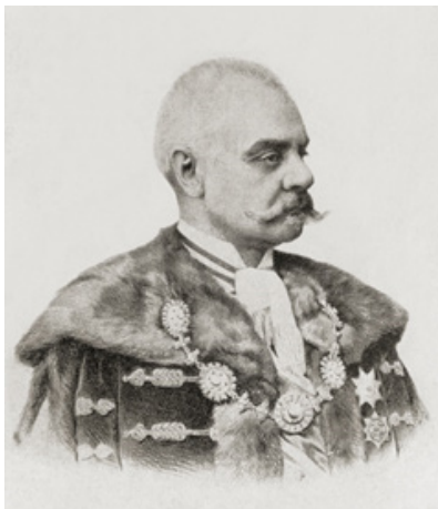
Прилог бр. 3: Портрет барона