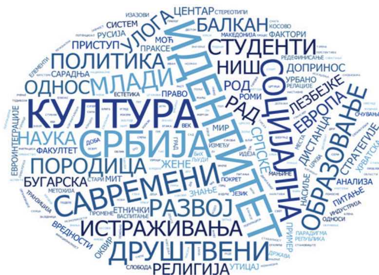
Слика 1: Најучесталији термини у НАСЛОВИМА РАДОВА у Годишњаку за социологију

Анализа учесталости термина/концепата у насловима, као и у кључним речима радова објављених у Годишњаку показују доминацију проблематике везане за питање идентитета (видети Слике 1 и 2 ). Овај налаз не чуди, с обзиром на то да су научни пројекти у које су били укључени чланови Департмана, али и истраживачи „са стране“ који су објављивали радове у часопису, као тему имали управо идентитет: „Традиција, модернизација, и национални идентитет у Србији и на Балкану“ (179074), „Одрживост идентитета Срба и националних мањина у пограничним општинама источне и југоисточне Србије“ (179013).