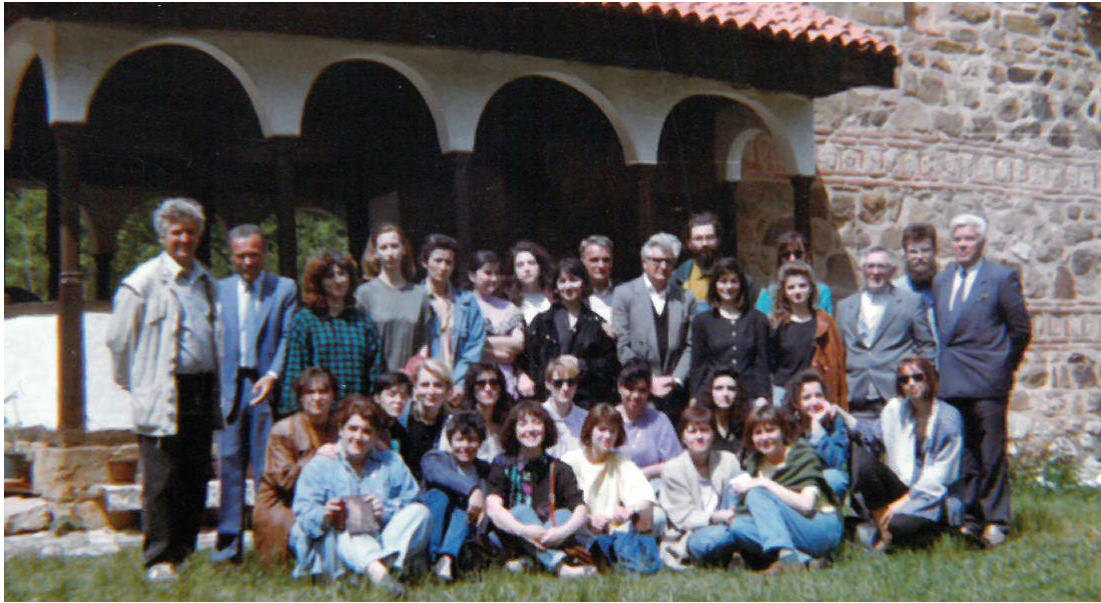
Екскурзија студената србистике у манастир Поганово, 1992. година