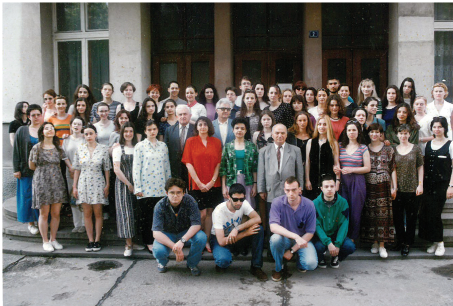
Студенти Групе за српски језик и књижевност 1999. године