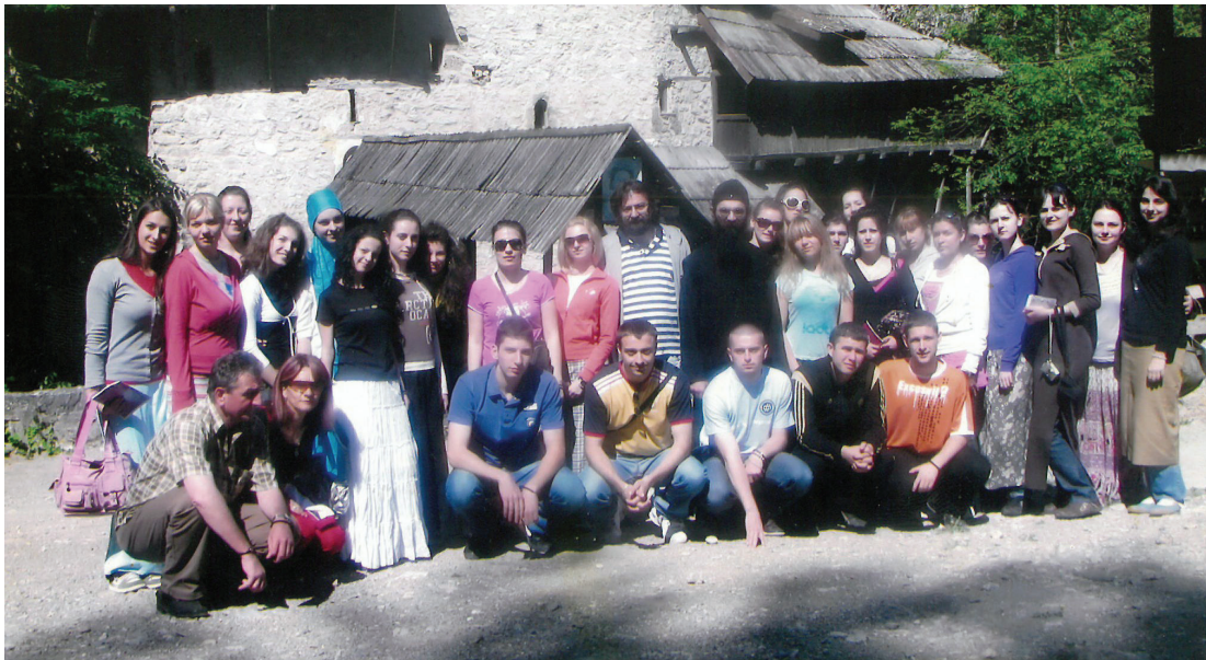
На Путу светлости