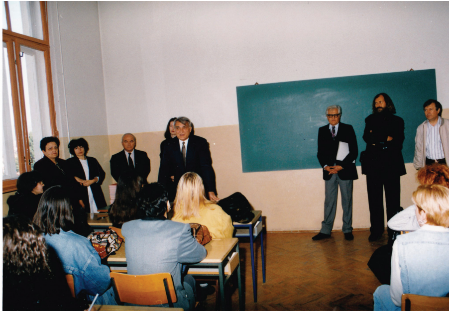
Додела индекса студентима српског језика и књижевности, 1996. година.