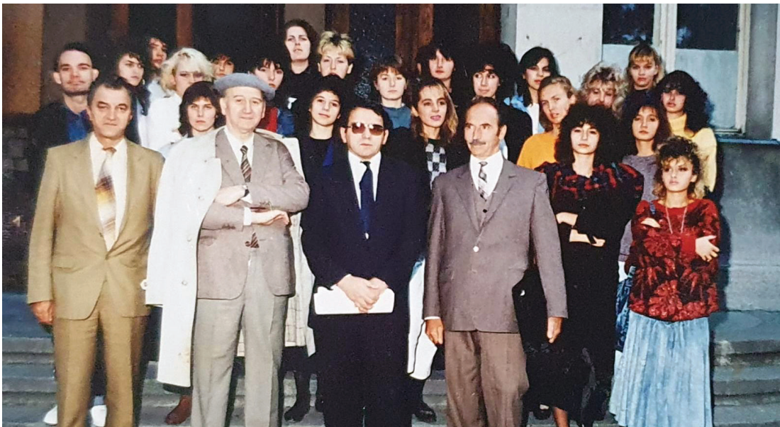
Студенти прве генерације Групе за српскохрватски језик и југословенске књижевности, 1987. година