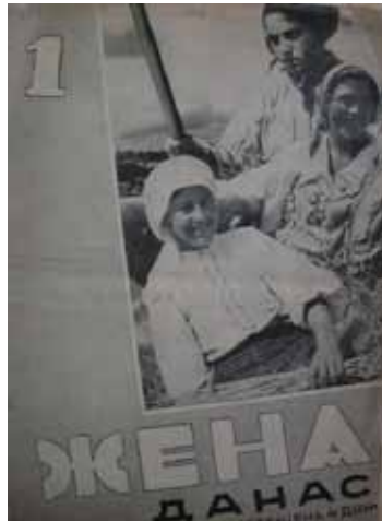
Слика 5. Жена данас , октобар, 1936.

жена Југославије и да их ангажује у борби против фашизма. 15 Већ на насловној страни првог броја налази се фотографија три младе совјетске раднице, од којих једна држи сноп жита, пожњевени плод сопственог рада, а друга заставу као симбол извојеване победе. Ускоро ће се наћи објављене и фотографије учесница шпанског грађанског рата, што је радикално другачији вид провокативности у односу на насловне стране Жене и света . Постављен насупрот моделу сентименталне женствености, модел жене борца отворено пропагира нову идеологију комунизма. Док је на насловним странама Жене и света , модерна градска жена градила своју индивидуалност поредећи се искључиво са својим мужем или оцем, часопис Жена данас је еманциповоа жену директно јој пружајући прилику да се докаже као „мушкарац“. С друге стране, независна жена, радница, научница и револуционарка конструишу слику анонимне жене, чији је положај одређен колективним потребама заједнице. 16 Субјективност и лична хтења су препрека на путу изградње утопистичке будућности. То је нарочито дошло до изражаја после Другог светског рата када је овај лист наставио са излагањем као орган АФЖ-а.