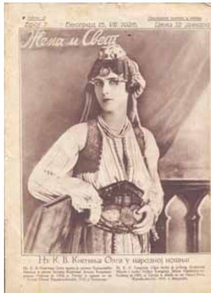
Слика 2. Кнегиња Олга, Жена и свет , бр. 7, 1926.

и место на којем ће се налазити „оно што је практично и корисно за жене“. 10 Циљ Жене и света , часописа дистрибуираног широм Краљевине Југославије, био је да читатељкама понуди забавно штиво, али и помоћ и савете у свим областима домаћег и друштвеног живота. Очување и развој заједнице Срба, Хрвата и Словенаца такође су били у средишту пажње уредништва, објављивањем извештаја о раду бројних женских удружења. У часопису је такође посебна пажња посвећивана краљевској породици – симболу грађанског поретка. Бројне фотографије краљице Марије у националној ношњи, одежди милосрдних сестара и слично представљене су као узор читатељкама, док су фотографије принчева, здраве и однеговане деце, биле пример на који се требало угледати у одгоју властитих потомака.