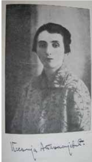
Слика 1. Ксенија Атанасијевић, Женски покрет , јануар-фебруар 1924.

Прва фотографија и прва илустрација генерално објављена у часопису Женски покрет , била је 1924. фотографија Ксеније Атанасијевић, доктора филозофије и прве жене професора на Београдском универзитету и у Краљевини уопште.