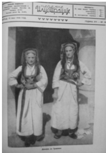
Слика 8. Девојке из Травника, Недељне илустрације , бр. 34, 1940.

Нешто касније ће то постати још очигледније јер ће холивудске глумице задржати привилегију приказивања на насловним странама, али ће се насупрот њима, на следећој страници, објављивати фотографије жена из конзервативних, муслиманских крајева Краљевине СХС. Током 1940. оваква сучељавања два различита света била су уобичајена у Недељним илустрацијама па ће се, на пример, насупрот Маргарет Локвуд наћи Девојка из Травника , док ће насупрот Полет Годар бити Девојка из околине Зенице .