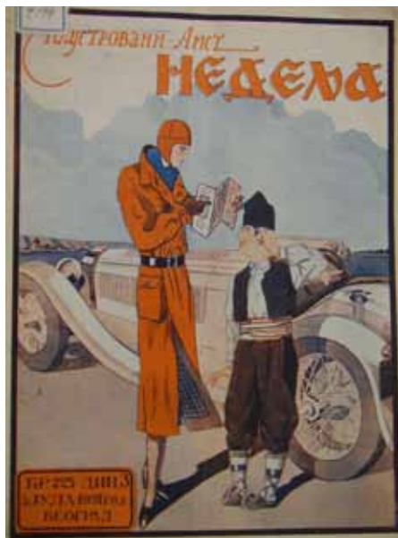
Слика 9. Недеља , бр. 225, 1931.

Илустрације у боји и понека обојена фотографија девојака на плажи, скијашица, оголелог пејзажа и слично уобичајене су на насловиме странама Недеље , илустрованог листа покренутог 1927. Фотографије спортисткиња такође су скретале пажњу на нови положај жене у друштву, док се честе фотографије жена-пилота, осим у контексту феминизма, могу читати и као сензационалистичке представе које ће увек пробудити знатижељу читалаца. У истом духу у коме су фотографије спортисткиња, личности уметничког живота и слично скретале пажњу на нови положај жене у друштву, то чини и модерна градска дама с ауто-картом у руци, обраћајући се збуњеном, традиционално обученом сељаку за правац. Иако анегдотска, ова представа на један прикривени начин износи актуелна питања тог времена. Да ли то што савремена жена вози и поседује сопствени аутомобил значи да ће она моћи да се снађе на свом путу без помоћи мушкарца, макар то био и просечан српски сељак?