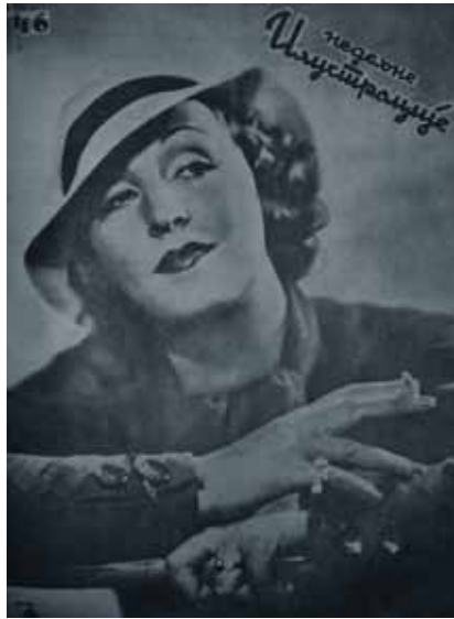
Слика 7. Бригита Хелм, Недељне илустрације , бр. 46, 1937.

Нешто касније ће то постати још очигледније јер ће холивудске глумице задржати привилегију приказивања на насловним странама, али ће се насупрот њима, на следећој страници, објављивати фотографије жена из конзервативних, муслиманских крајева Краљевине СХС. Током 1940. оваква сучељавања два различита света била су уобичајена у Недељним илустрацијама па ће се, на пример, насупрот Маргарет Локвуд наћи Девојка из Травника , док ће насупрот Полет Годар бити Девојка из околине Зенице .