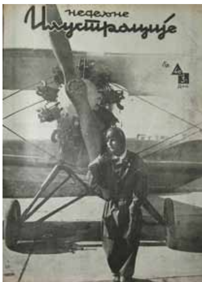
Слика 6. Џени Томић, Недељне илустрације , бр. 40, 1933.

Недељне илустрације излазиле су у Београду од 1925. до априла 1941. Иако је садржај часописа био веома разноврстан, фотографије жена су заузимале много места, посебно на насловним странама. Почетком тридесетих година то су биле угледне београдске даме, победнице избора за мис и глумице чије фотографије није пратила легенда већ чланак унутар часописа, који је доносио читаоцима догађаје из њиховог приватног живота. Уредништво Недељних илустрација је, с једне стране, пружало подршку еманципацији, али је с друге стране, покушавало да успостави компромис. Средином 1933. на насловној страни налази се фотографија Џени Томић, прве дипломиране жене-пилота, 18 али и гламурозна и заводљива представа глумице Бригите Хелм са цигаретом. Док се Џенина посебност и успех похваљују, уз фотографију Бригите Хелм се наводи да је „фатална жена авантуристичког духа“ на великом екрану, у приватном животу заправо „скромно и тихо створење“, чиме се подвлачи разлика између слике и стварности.