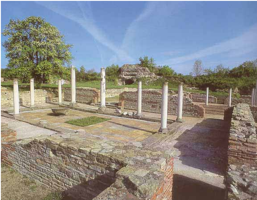
Слика 4. Феликс Ромулијана

Завичајни музеј Књажевац зграда је у склопу градског језгра, саграђена као двојна породична стамбена зграда у власништву породице Сибиновић, бивших власника тимочких рудника „Добра срећа“. Подигнута је 1906. године и припада врсти културних добара грађанске архитектуре са стилским карактеристикама сецесије, значајним за период са почетка XX века. Музејска стална поставка састоји се из археолошког, етнолошког, историјског, уметничког и геолошко-природњачког дела. Хронолошки и тематски изложени су