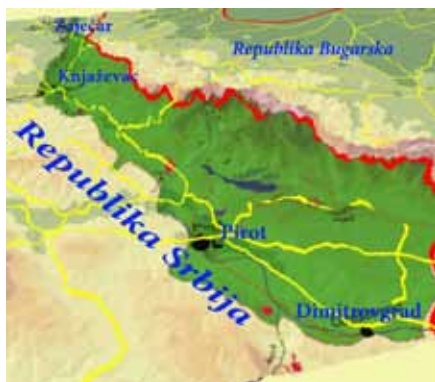
Слика 1. Саобраћајно-географски положај Старе планине

Србија се налази на Коридору X (аутопуту Салцбург–Солун, укључујући делове Будимпешта–Београд и Ниш–Софија–Истанбул). Део који пролази кроз Србију, Шид–Београд–Ниш, дуг је 374 км и повезује источни део Србије са Београдом. Ниш је магистралним путем (М 25) повезан са Књажевцем и Зајечаром. Према југоистоку магистрални пут (М 1.12) води правцем Ниш–Пирот–Димитровград који је одмах уз границу са Бугарском. Књажевац и Пирот повезује само један регионални пут (Р 121), који пролази кроз Калну и наставља даље према Димитровграду. Други регионални правац Р 247 из Минићева повезује северни део Старе планине.