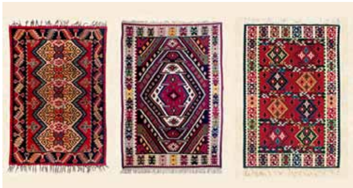
Слика 5. Пиротски ћилими

Пирот је био центар грнчарског заната у Србији. Средином XIX века имао је чак 40 грнчарских радионица. На простору Пирота и Беле Паланке народно традиционално грнчарство било је под разним утицајима са стране. Већ крајем XIX века значај грнчарства опада па се број грнчарских радионица смањило на 32. Градови на северу и западу Србије су после ослобођења од Турака почели нагло да се развијају па је велики број мајстора - грнчара из Пирота и околине отишао у печалбу у те крајеве.