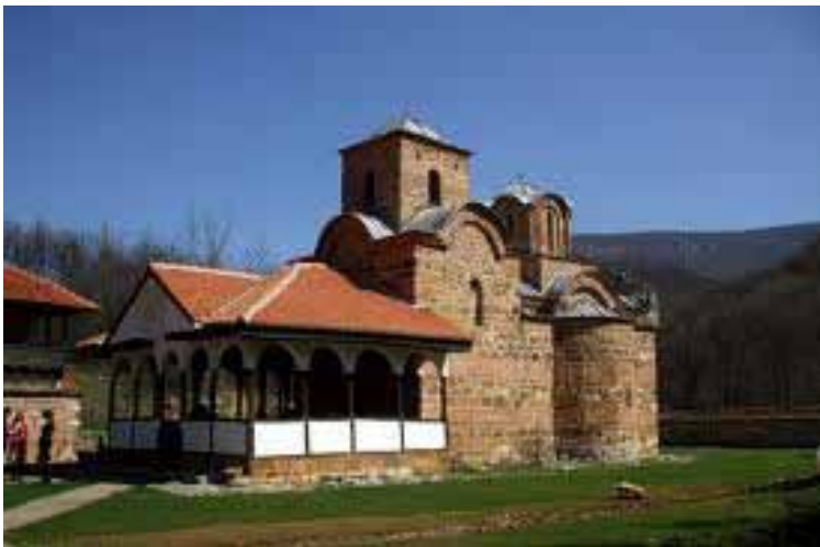
Слика 2. Манастир Поганово

Један од најзначајнијих средњовековних споменика културе Понишавља из XIV века јесте манастир Поганово (Станковић, 1994). Налази се на левој обали Јерме, 25 км од Пирота. Манастир је смештен између Одоровачког и Влашког ждрела. Грађен је у моравском стилу од ломљеног камена и кречњака. Посвећен је светом јеванђелисти Јовану Богослову, као задужбина Константина Дејановића Драгаша и његове кћерке Јелене Драгаш.