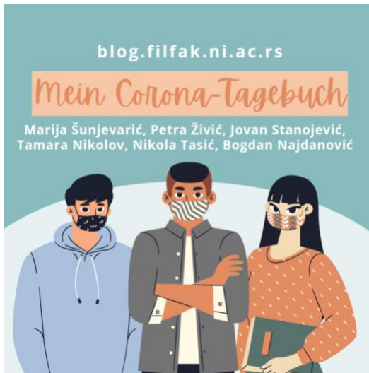
Слика 4: Промотивни постер за прилоге на блогу.