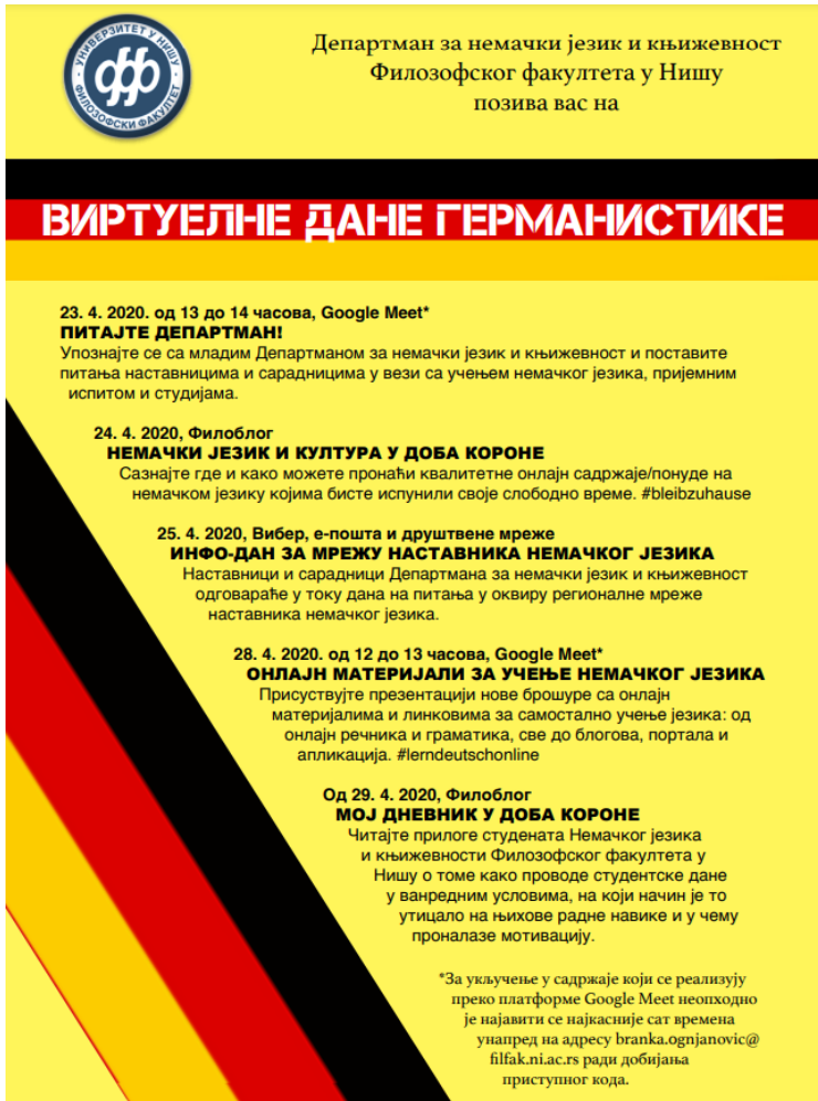
Слика 1: Постер за Виртуелне дане германистике одржане 2020. године.