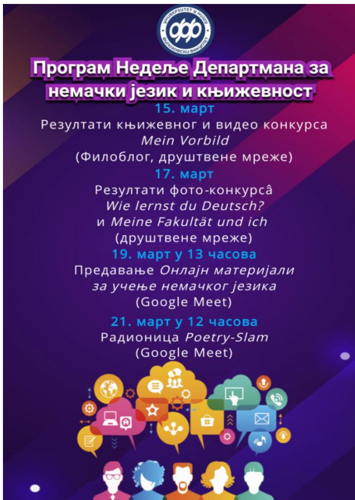
Слика 2: Постер за Недељу Департмана за немачки језик и књижевност одржану 2021. године.