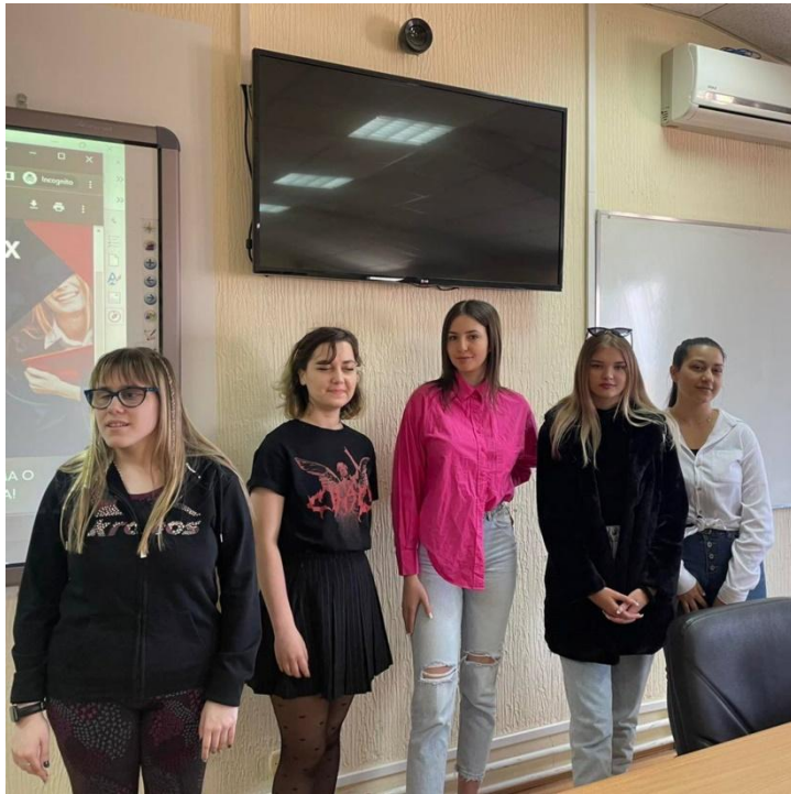
Слика 9: Добитнице награда на књижевном конкурсy Mein Lieblingsfantasybuch oder -film .

alle zeigen uns den richtigen Weg, den wir alle einschlagen sollten. Denkt ihr nicht?