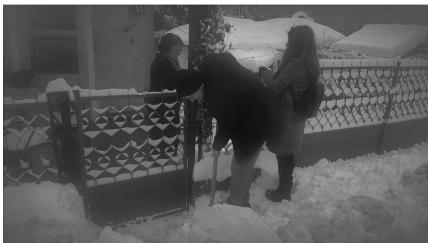
Slika 1. Studija 2018. - prikupljanje podataka. Slika sa terena.