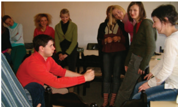
Slika 5. Radionica u okviru edukacije „Primena teorije dinamičkih kompetencija na razvoj kreativnosti”, Univerzitet u Nišu, Filozofski fakultet, 2006.

U okviru te saradnje sa Udruženim Laboratorijama za ispitivanje mozga i Laboratorijom za psihologiju umetnosti iz Beograda 2006. i 2007. godine realizovane su jednosemestralne edukacije studenata Filozofskog fakulteta u Nišu pod nazivom „Primena teorije dinamičkih kompetencija na razvoj kreativnosti”. U okviru edukacije organizovano je više radionica po čijem završetku su polaznici edukacije imali zadatak da urade završni rad – da samostalno osmisle i realizuju radionicu i prezentuju je pred komisijom. Za ove aktivnosti i stečena znanja dobili su odgovarajuće sertifikate (Slika 5).