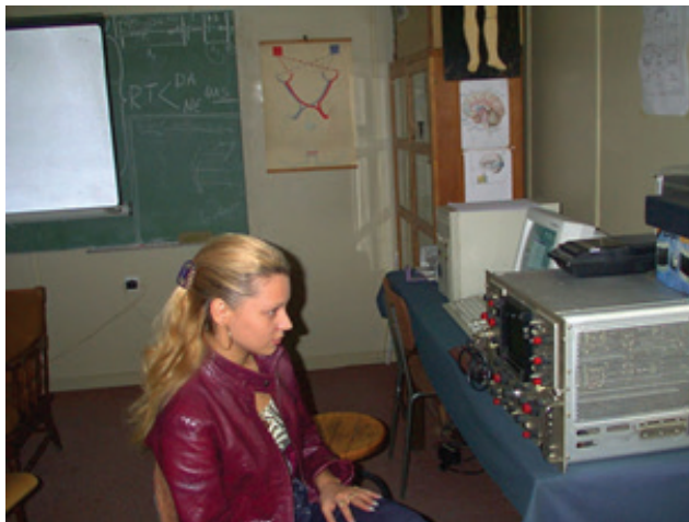
Slika 3. Laboratorija za eksperimentalnu psihologiju 2001.

Laboratorija za eksperimentalnu psihologiju (kasnije kao LPI) Departmana za Psihologiju nastavila je sve do danas bogatu saradnju sa LEP Filozofskog fakulteta u Beogradu i profesorom Ognjenovićem. Nakon dogovora sa prof. Ognjenovićem sklopljen je ugovor o uzajamnoj saradnji sa Udruženim laboratorijama za ispitivanje ljudskog mozga i Laboratorijom za psihologiju umetnosti (Slika 4). Naime, na inicijativu profesora Predraga Ognjenovića Brace, potpisan je 2005. g. ugovor o saradnji Udruženih laboratorija za ispitivanje ljudskog mozga u Beogradu i Laboratorije za eksperimentalnu psihologiju na Studijskoj grupi za psihologiju u Nišu.